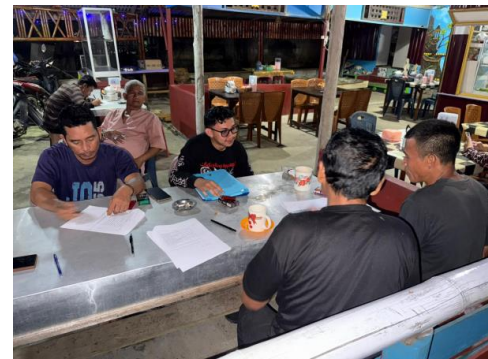
Gambar 1. Proses pengisian kuisioner.