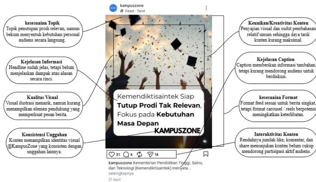
Gambar 2. Postingan instagram @kampuszone dengan tingkat keterlibatan audiens lebih rendah

yang mudah dipahami. interaktivitas konten terlihat dari aktivitas pengguna berupa like, komentar, share, dan save yang tinggi menunjukkan respons audiens terhadap konten tersebut.