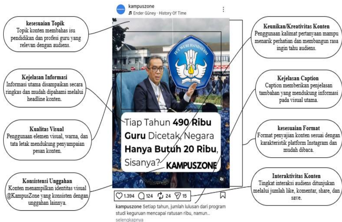
Gambar 1. Pemetaan indikator strategi konten dengan tingkat keterlibatan audiens tinggi pada postingan instagram @kampuszone

Sebelum membahas hasil perhitungan IPA, perlu ditunjukkan contoh konten yang dijadikan objek penelitian dan konten lain yang memiliki tingkat keterlibatan audiens lebih rendah. Penyajian visual ini membantu menyajikan gambaran mengenai karakteristik konten yang dianalisis, sehingga interpretasi terhadap hasil IPA dapat lebih menyeluruh.