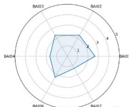
Gambar 3. Grafik Radar Domain BAI (Penelitian, 2025 3)