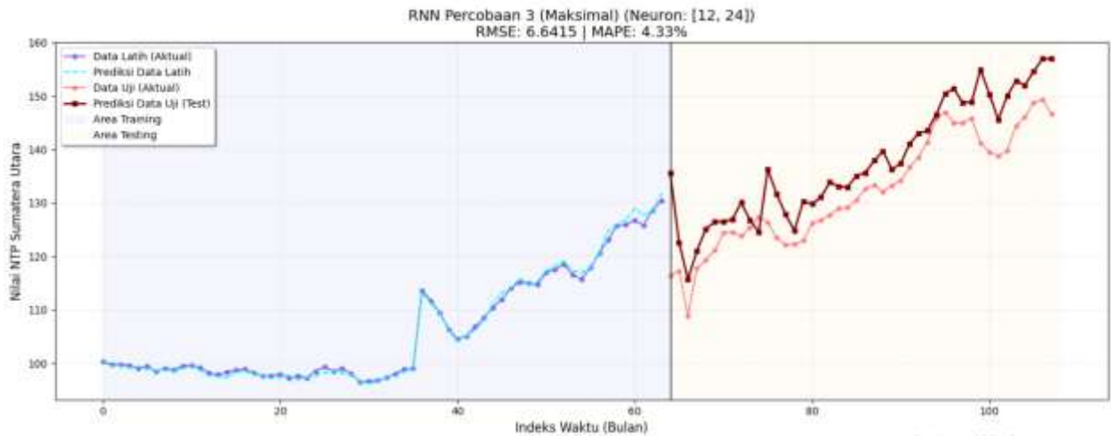
Gambar 4. Percobaan 3

Temuan utama dari penelitian ini adalah Sinergi Densitas Tinggi dan Konvergensi Cepat yang menghasilkan MAPE terendah sebesar 1.45% pada Skenario 3. Jaringan syaraf dapat mengidentifikasi interaksi tersembunyi antar variabel laten dalam data NTP karena jumlah neuron yang signifikan () terletak pada lapisan tersembunyi. Sangat menarik bahwa model tidak mengalami osilasi liar meskipun menggunakan learning rate yang agresif (0.015). Hal ini menunjukkan bahwa mekanisme koreksi bias Adam optimizer sangat efektif, karena ia secara otomatis memperkecil langkah pembaruan bobot seiring dengan penurunan gradien global. Model ini dapat menangani fase pertumbuhan agresif yang tidak berpola linier, karena kurva data aktual BPS hampir sama dengannya, bahkan pada titik tertinggi 149.33.