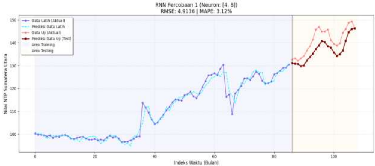
Gambar 2. Percobaan 1

Dalam skenario pertama, dengan proporsi data latih 80% dan 130 epoch, model membutuhkan waktu yang sangat lama untuk menyesuaikan bobot secara menyeluruh. Kurva belajar yang sangat stabil dan mulus tanpa osilasi pada fungsi kehilangan dihasilkan dengan rate learning standar (0.001). Meskipun demikian, struktur neuron yang tipis () membatasi kemampuan model untuk menyimpan fitur non-linier dari anomali 2022. Meskipun MAPE 2.34% sudah sangat akurat untuk standar ekonomi, model ini cenderung "terlambat" untuk menanggapi lonjakan data yang luar biasa yang akan terjadi pada akhir periode 2024.