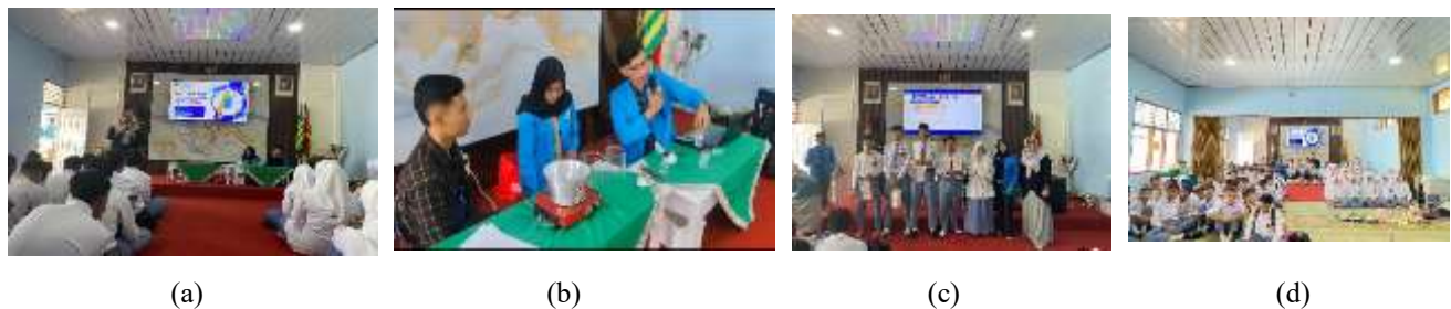
Gambar 2. (a) Penjelasan pembuatan deodorant spray (b) Praktek pembuatan deodorant spray (c) Pemberian hadiah untuk siswa (d) Foto bersama dengan peserta .

Peningkatan pengetahuan dan keterampilan melalui kegiatan edukasi telah terbukti memberikan dampak positif yang signifikan bagi peserta, sebagaimana ditunjukkan oleh berbagai kegiatan pengabdian serupa yang mencatat peningkatan pemahaman peserta setelah mengikuti program. Selain meningkatkan keterampilan teknis, kegiatan ini juga memberikan dampak positif dalam meningkatkan kesadaran siswa terhadap penggunaan bahan alami sebagai alternatif produk perawatan diri yang lebih aman dan ekonomis. Hal ini penting dalam membangun pola hidup sehat sejak dini, sekaligus membuka peluang pengembangan keterampilan kewirausahaan sederhana berbasis produk herbal.