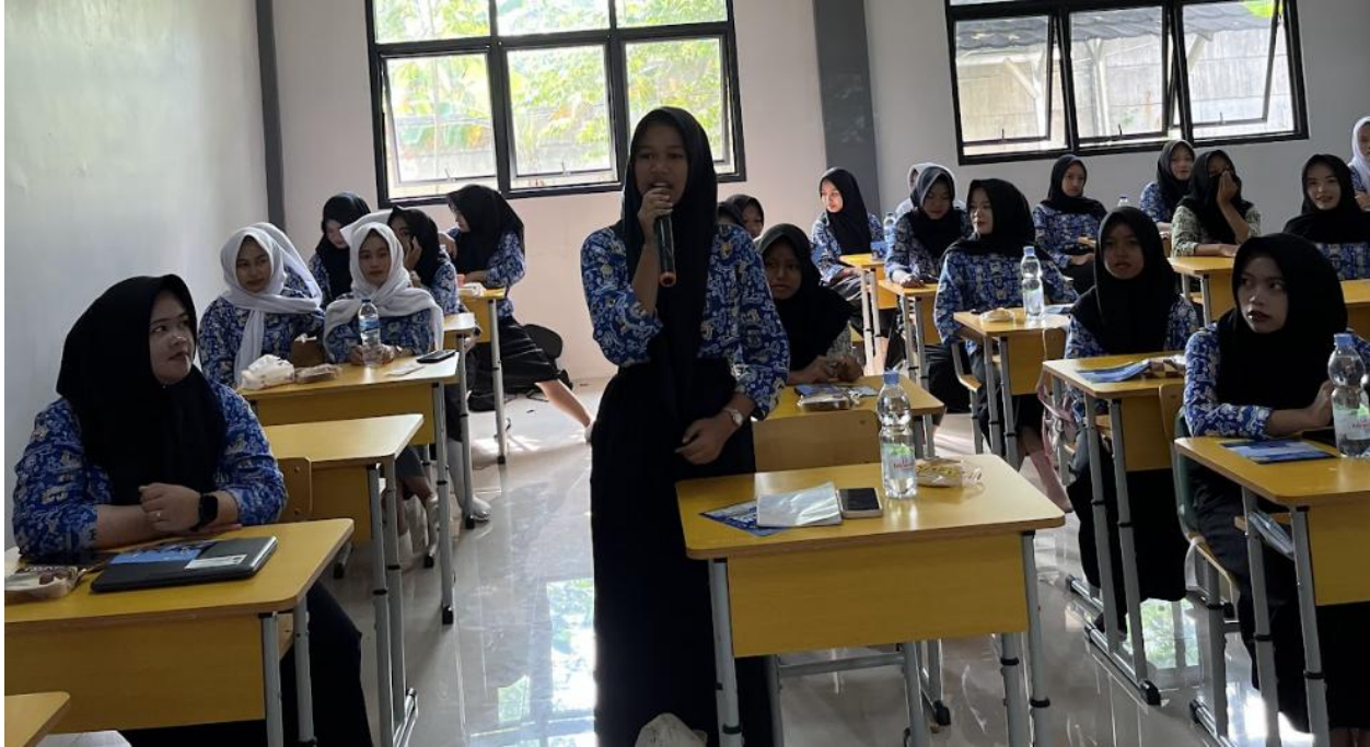
Gambar 3. Sesi diskusi dan refleksi akhir kegiatan PkM

pemahaman kognitif, tetapi juga menumbuhkan minat afektif terhadap pemrograman, sejalan dengan temuan (Bers et al., 2014).