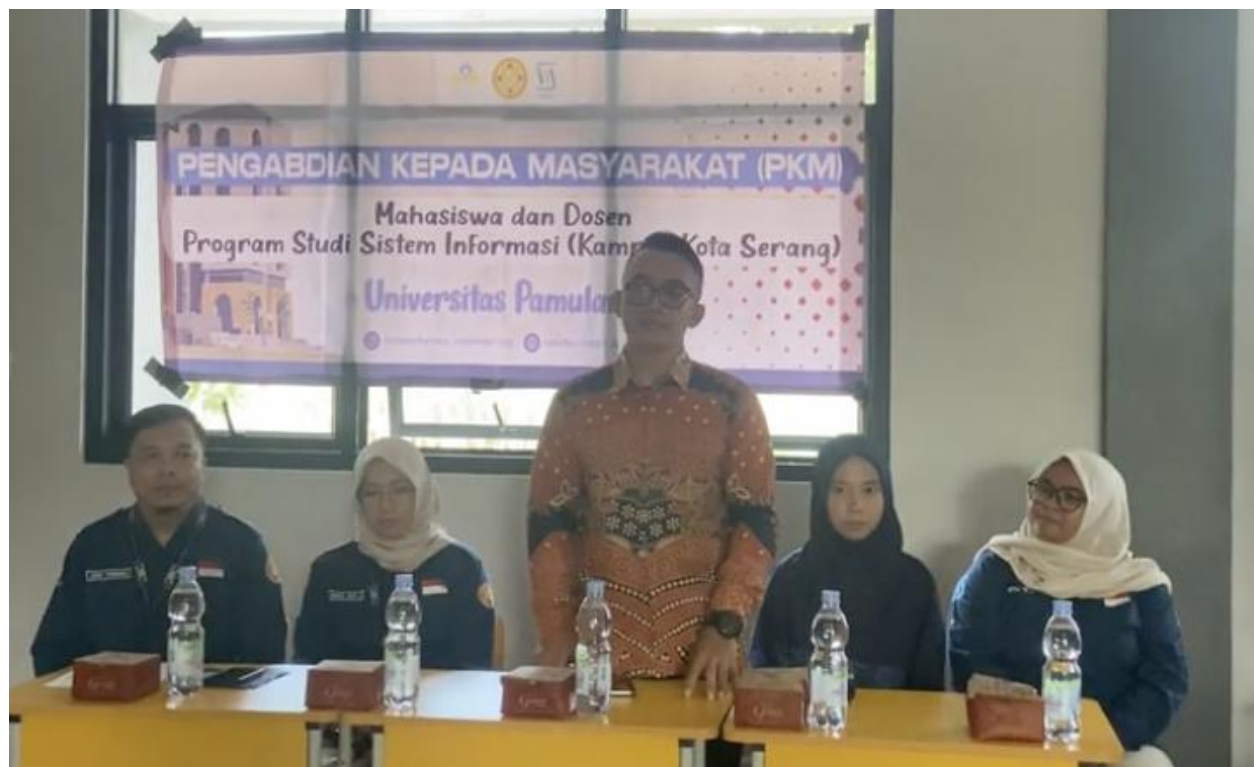
Gambar 1. Pembukaan dan sambutan kegiatan PkM di SMKN 1 Padarincang

Tabel 2 menunjukkan bahwa seluruh aspek mengalami peningkatan yang signifikan. Aspek Computational Thinking (S03) mencatat peningkatan tertinggi sebesar 184,8%, diikuti Penggunaan Scratch (S06) sebesar 172,8% dan Percabangan/if-then (S07) sebesar 168,5%. Hal ini menunjukkan bahwa meskipun CT merupakan konsep yang paling asing bagi siswa sebelum pelatihan, pendekatan pembelajaran berbasis Scratch yang visual dan kontekstual sangat efektif dalam membangun pemahaman tersebut. Aspek Konsep Algoritma (S01), Motivasi Belajar (S09), dan Relevansi Jurusan (S10) mencatat peningkatan moderat (46,4%-55,0%) karena memiliki skor awal yang relatif lebih tinggi, sehingga ruang peningkatannya lebih kecil (ceiling effect).