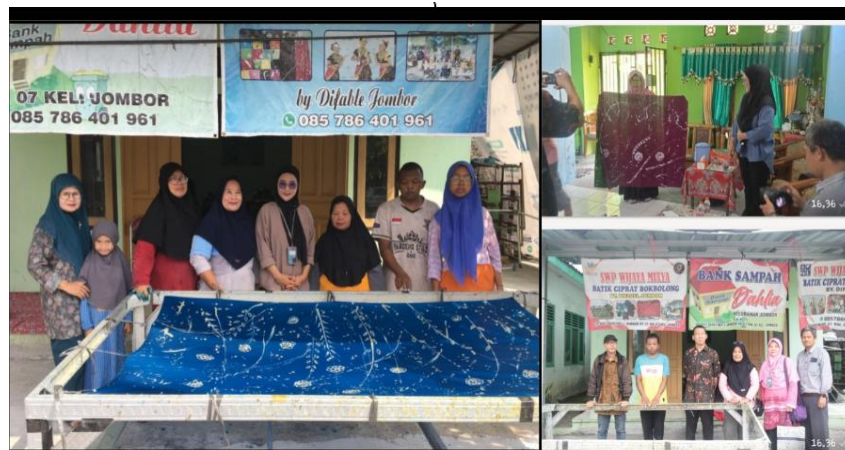
Gambar 4. Pendampingan eksplorasi dan desain batik ciprat

Dalam praktik tersebut, anggota komunitas mencoba membuat beberapa alternatif desain dengan variasi pola dan kombinasi warna yang berbeda. Tim pendamping memberikan arahan dan umpan balik terhadap setiap hasil desain sehingga peserta dapat memperbaiki dan menyempurnakan hasil karya yang dibuat. Hasil praktik menunjukkan adanya peningkatan kreativitas yang terlihat dari semakin beragamnya motif, penggunaan warna yang lebih harmonis, serta komposisi desain yang lebih seimbang. Produk yang dihasilkan juga menunjukkan karakter visual yang lebih kuat dibandingkan dengan kondisi awal sebelum pendampingan ditunjukkan pada gambar 4 di bawah ini.