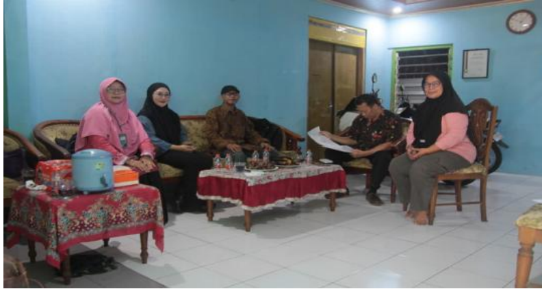
Gambar 2. Observasi dan diskusi awal bersama ketua komunitas

visual, sehingga variasi produk belum berkembang secara maksimal. Selain itu, anggota komunitas juga menyampaikan adanya kesulitan dalam menentukan kombinasi warna yang harmonis dan menciptakan motif yang lebih inovatif. Temuan tersebut menjadi dasar dalam penyusunan materi pendampingan yang difokuskan pada pengembangan kreativitas desain dan peningkatan kualitas visual produk batik ciprat. Gambar 2 merupakan kunjungan awal tim ke komunitas batik ciprat.