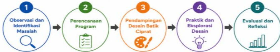
Gambar 1. Tahap pelaksanaan pengabdian kepada masyarakat

Kegiatan PkM dilaksanakan pada Komunitas Batik Ciprat Difabel Gadingan di Desa Jombor, Kecamatan Bendosari, Kabupaten Sukoharjo. Metode pelaksanaan kegiatan dilakukan melalui beberapa tahapan seperti pada gambar 1 di bawah ini :