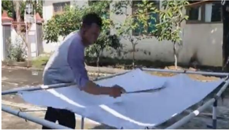
Gambar 3. Pendampingan dan eksplorasi desain batik ciprat

perubahan pada proses kreatif anggota komunitas. Peserta mulai mampu merancang komposisi desain sebelum proses pencipratan dilakukan dan lebih berani mencoba variasi warna yang sebelumnya belum digunakan.