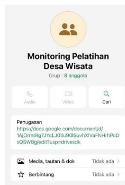
Gambar 11 Grup Monitoring Pasca Pelatihan