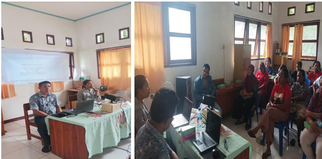
Gambar 3. Sesi Literasi Keuangan dan Literasi Digital

Dari sudut pandang keberlanjutan usaha, pencatatan keuangan sederhana merupakan instrument dasar untuk memastikan keberlangsungan kelompok. Transparansi dalam pengelolaan dana juga menjadi mekanisme internal untuk menjaga kepercayaan antaranggota. Dengan demikian, intervensi ini tidak hanya meningkatkan keterampilan teknis, tetapi juga memperkuat tata kelola kelompok.