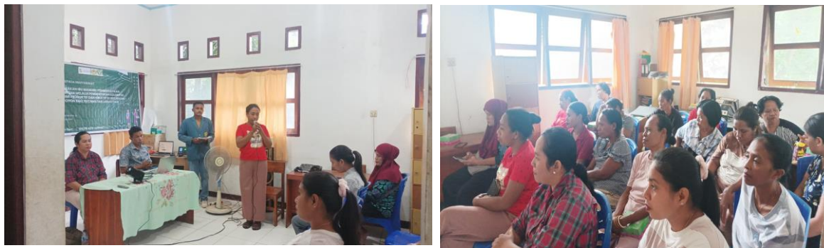
Gambar 1. Workshop Gerakan Ibu Mandiri

Berdasarkan tabel 1, seluruh indikator keberhasilan yang ditetapkan dalam rencana kegiatan berhasil dicapai, bahkan pada dua indikator utama capaiannya melampaui target awal. Rencana pengabdian menargetkan terbentuknya satu KEPK sebagai indikator keberhasilan awal (minimal 80% peserta terdorong membentuk kelompok), namun dalam implementasi terbentuk dua KEPK yang disepakati bersama dan ditandai dengan pembacaan serta penandatanganan Berita Acara Pembentukan Kelompok yang difasilitasi oleh Pemerintah Kelurahan Pohon Bao. Demikian pula pada indikator literasi digital, target satu akun media sosial terlampaui dengan terbentuknya dua akun Instagram aktif atas nama Ibu Mandiri Pohon Bao dan Ibu Cerdas Ceria . Hasil ini menunjukkan bahwa tingkat penerimaan dan motivasi peserta melebihi ekspektasi awal program, dan menjadi bukti awal terbangunnya collective agency dalam konteks pemberdayaan perempuan berbasis komunitas.