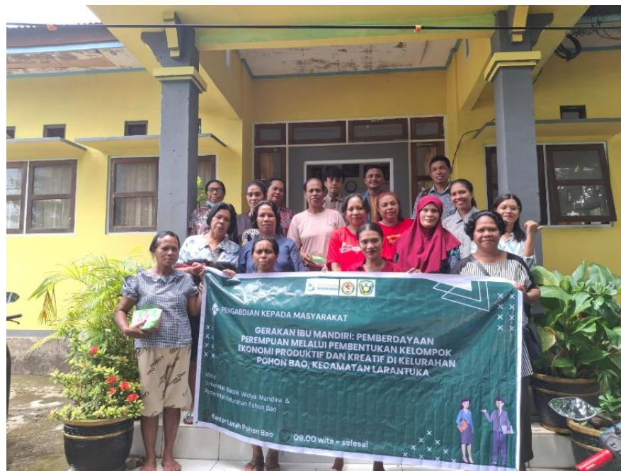
Gambar 6. Dokumentasi Bersama Tim Pengabdian

Dalam jangka pendek, kegiatan ini telah menghasilkan tiga luaran terukur: 1) dua KEPK yang terbentuk secara formal dengan Berita Acara yang sah; 2) dua akun media sosial aktif sebagai infrastruktur pemasaran digital awal; serta 3) peningkatan kapasitas manajerial dan literasi keuangan dasar bagi 25 peserta. Luaran-luaran ini merupakan fondasi awal yang nyata bagi kemandirian ekonomi perempuan di Kelurahan Pohon Bao. Dalam jangka panjang, model Gerakan Ibu Mandiri memiliki potensi replikasi yang tinggi untuk diterapkan di kelurahan-kelurahan lain di Kecamatan Larantuka maupun Kabupaten sekitarnya yang memiliki karakteristik demografis serupa. Peluang pengembangan ke depan meliputi: 1) pendampingan lanjutan secara berkala oleh tim pengabdian atau Dinas UKM untuk memastikan keberlanjutan aktivitas KEPK; 2) fasilitas akses permodalan melalui program KUR atau dana hibah UMKM; 3) pengembangan produk unggulan berbasis kearifan lokal yang dipasarkan melalui platform digital; serta 4) integrasi program ke dalam kebijakan resmi pemberdayaan perempuan ditingkat kabupaten sebagai praktik baik ( best practice ) yang dapat didokumentasikan dan direplikasi secara sistematis.