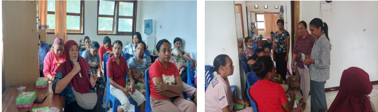
Gambar 5. Sesi Diskusi