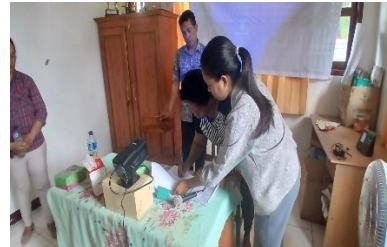
Gambar 2. Penandatanganan Berita Acara Pembentukan Dua KEPK