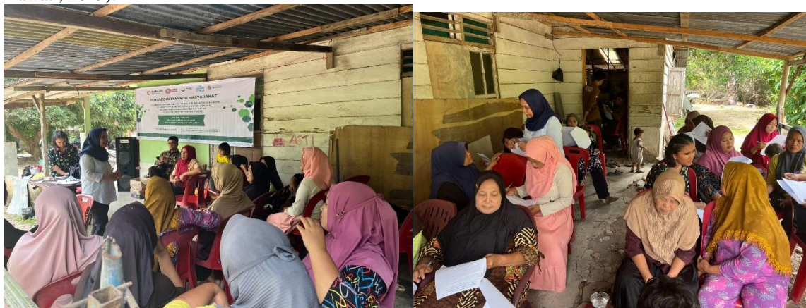
Gambar 2. Sosialisasi pemanfaatan tumbuhan obat keluarga

Kegiatan yang diadakan di Desa Padang Sari ini bertujuan untuk mengajarkan ibu rumah tangga cara-cara praktis dalam memanfaatkan tanaman obat di lingkungan sekitar mereka sebagai alternatif pengobatan. Hal ini menunjukkan bahwa pendekatan edukasi berbasis tumbuhan obat memiliki potensi besar dalam mendukung pola hidup sehat dan mandiri bagi masyarakat desa. Sosialisasi pemanfaatan tanaman obat dapat meningkatkan keterampilan ibu rumah tangga dalam membuat ramuan herbal yang bermanfaat untuk kesehatan keluarga (Rahmawati, 2019).