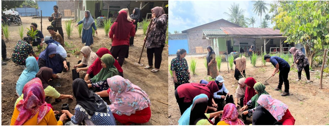
Gambar 3. Penanaman TOGA bersama ibu-ibu

Penanaman beberapa tumbuhan yang dilakukan disamping pekarangan dilakukan oleh tim dan ibu-ibu rumah tangga yang sebelumnya sudah diberikan sosialisasi. Para ibu-ibu sangat antusias dalam melakukan penanaman baik di polybag maupun di tanah langsung. Umumnya masyarakat di wilayah tersebut masih memiliki lahan pekarangan yang cukup luas, sehingga pemanfaatan dan pengelolaan lingkungan dapat dioptimalkan dengan penanaman TOGA. Berdasarkan observasi di lapangan diketahui bahwa beberapa ibu rumah tangga telah menanam TOGA, namun demikian jumlah TOGA yang ditanam jumlahnya terbatas. Sebagian dari mereka telah mengetahui khasiat TOGA dan secara teknis juga telah mampu mengolah TOGA, namun demikian mereka belum memahami khasiat TOGA secara ilmiah. Oleh karena itu perlu dilakukan pelatihan tentang khasiat TOGA secara ilmiah. Masyarakat yang telah memiliki pengetahuan tentang khasiat TOGA dan menguasai cara pengolahannya dapat membudidayakan tanaman obat secara individual dan memanfaatkannya sehingga akan terwujud prinsip kemandirian dalam pengobatan keluarga. Selain itu juga dapat dikembangkan menjadi usaha kecil dan menengah di bidang obat-obatan herbal, yang selanjutnya dapat disalurkan ke masyarakat.