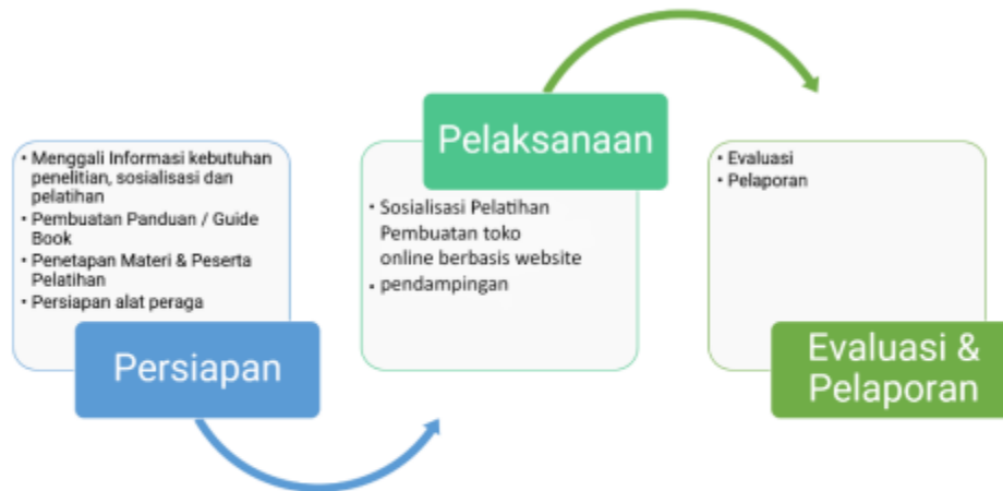
Gambar 2. Prosedur Kerja

Dengan mengikuti prosedur kerja di dibawah ini, diharapkan pelatihan pembuatan toko online berbasis website dapat sukses dilaksanakan, memberikan manfaat yang signifikan bagi promosi produk UMKM desa, dan meningkatkan ekonomi serta kesejahteraan masyarakat Desa Suka Damai .