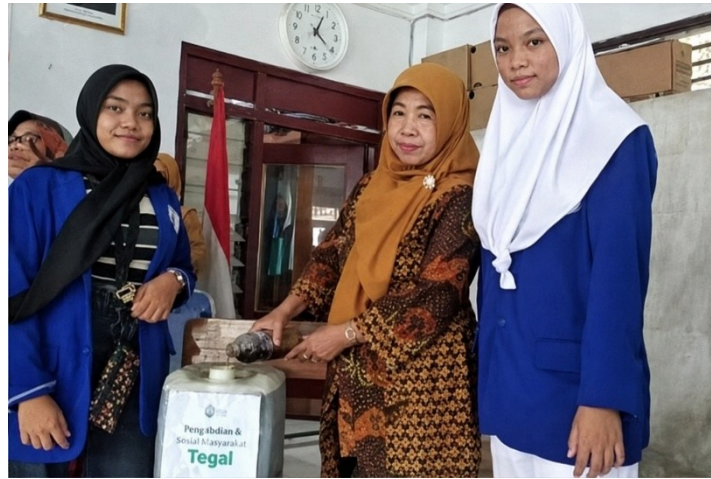
Gambar 3. Serah terima jelantah ke Rumah Sosial Kutub

Capaian 10 liter dalam tiga bulan mencerminkan kondisi awal program yang baru diperkenalkan kembali kepada warga. Angka ini wajar mengingat mayoritas warga bermata pencaharian di sektor konveksi yang tidak banyak menghasilkan limbah jelantah. Meski demikian, capaian ini menjadi baseline yang penting untuk pengembangan program ke depan. Sebagai perbandingan, Emalia et al. (2023) melaporkan bahwa program pengolahan minyak bekas berbasis komunitas membutuhkan setidaknya enam bulan untuk mencapai partisipasi yang signifikan secara ekonomi.