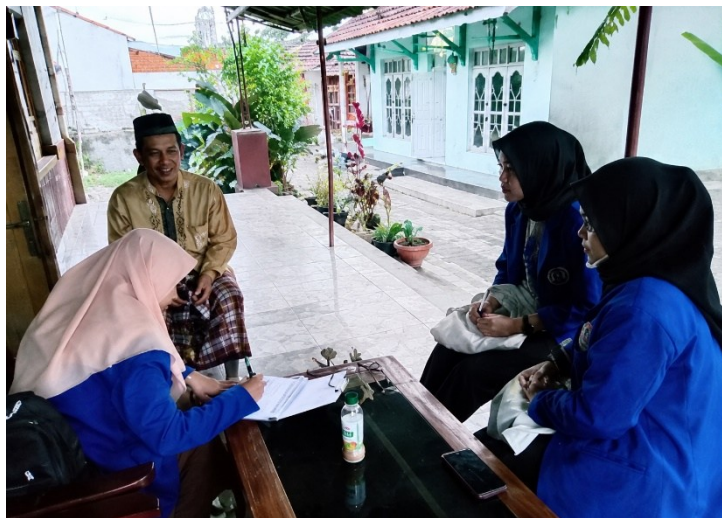
Gambar 2. Kegiatan penyuluhan bahaya minyak jelantah kepada warga Desa Tembok Banjaran

Penyuluhan bahaya minyak jelantah dilaksanakan melalui pertemuan ibu-ibu kader posyandu, pengajian, dan pendekatan door-to-door . Kegiatan ini disambut dengan respons yang cukup baik oleh sebagian besar warga. Materi yang disampaikan mencakup dampak minyak jelantah terhadap kesehatan termasuk risiko kanker, hipertensi, dan penyakit jantung koroner serta dampaknya terhadap ekosistem air dan kesuburan tanah akibat pembuangan sembarangan.