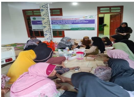
Gambar 2. Pelatihan pembuatan dawet

Tahap kedua pada kegiatan pengabdian masyarakat adalah pelatihan pembuatan es dawet yang dilakukan dengan cara demonstrasi seperti pada Gambar 1. Pelatihan ini juga memberikan materi tentang program gemar ikan yang sedang digalakkan oleh pemerintah. Program gemar ikan atau gerakan makan ikan ini bertujuan untuk meningkatkan konsumsi ikan di masyarakat, karena hasil perikanan di Indonesia cukup melimpah, namun tingkat konsumsi ikan masyarakat Indonesia mencapai 54,49 kg, lebih rendah dari Malaysia yang mencapai 70 kg (Kementerian Kelautan dan Perikanan, 2017). Sehingga program gemar ikan sangat perlu untuk disosialisasikan agar dapat meningkatkan konsumsi makan ikan masyarakat Indonesia.