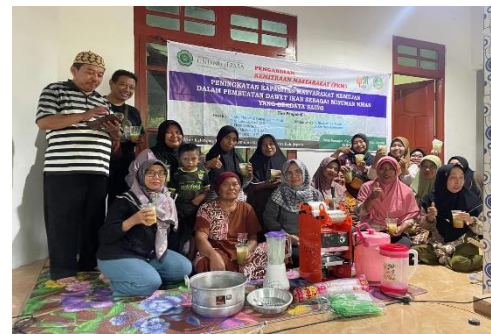
Gambar 3. Produk dawet ikan

Proses pembuatan dawet berbahan baku ikan ini terdiri dari beberapa proses. Tahap pertama yaitu membersihkan ikan dari sisa kotoran serta mengeluarkan isi perutnya. Selanjutnya ikan dibelah berbentuk kupu-kupu kemudian dikeruk bagian dagingnya. Tahapan ketiga yaitu menghaluskan daging ikan untuk kemudian dicampurkan dengan bahan pembuat cendol lainnya seperti tepung beras dan tepung tapioka. Pewarnaan cendol dilakukan dengan menambahkan air rebusan daun suji, kemudian campuran adonan tersebut direbus dengan api kecil sampai mengental. Tahap terakhir adalah pencetakan cendol dengan menggunakan cetakan cendol. Lalu cendol disajikan dengan tambahan santan dan gula aren yang kemudian disebut dengan Es dawet atau es cendol.