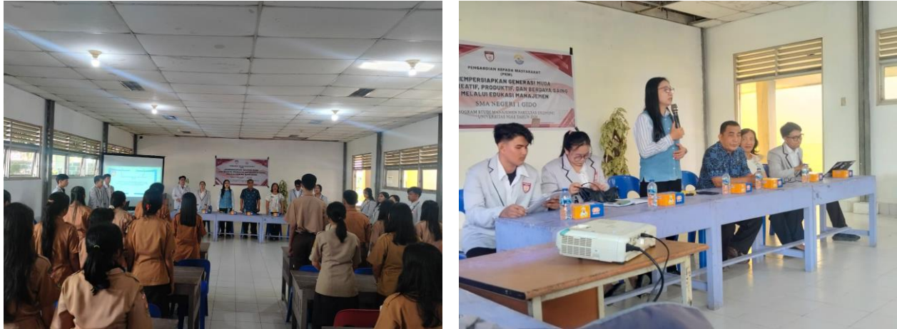
Gambar 2. Kata Sambutan

Materi yang disampaikan pada sesi utama menjadi inti dari kegiatan PKM ini. Penyampaian dimulai dari pengertian dasar manajemen, yaitu proses perencanaan, pengorganisasian, pengarahan, dan pengawasan sumber daya untuk mencapai tujuan secara efektif dan efisien. Penjelasan ini penting karena banyak siswa sebelumnya hanya mengenal manajemen dalam konteks perusahaan atau dunia kerja, padahal hakikat manajemen jauh lebih luas dan dapat diterapkan dalam kehidupan sehari-hari. Melalui penjelasan yang sederhana dan contoh-contoh yang dekat dengan kehidupan pelajar, siswa mulai memahami bahwa mereka sebenarnya sudah berinteraksi dengan prinsip manajemen ketika mengatur waktu belajar, menyusun jadwal kegiatan, membagi tugas kelompok, atau mempersiapkan diri menghadapi ujian.