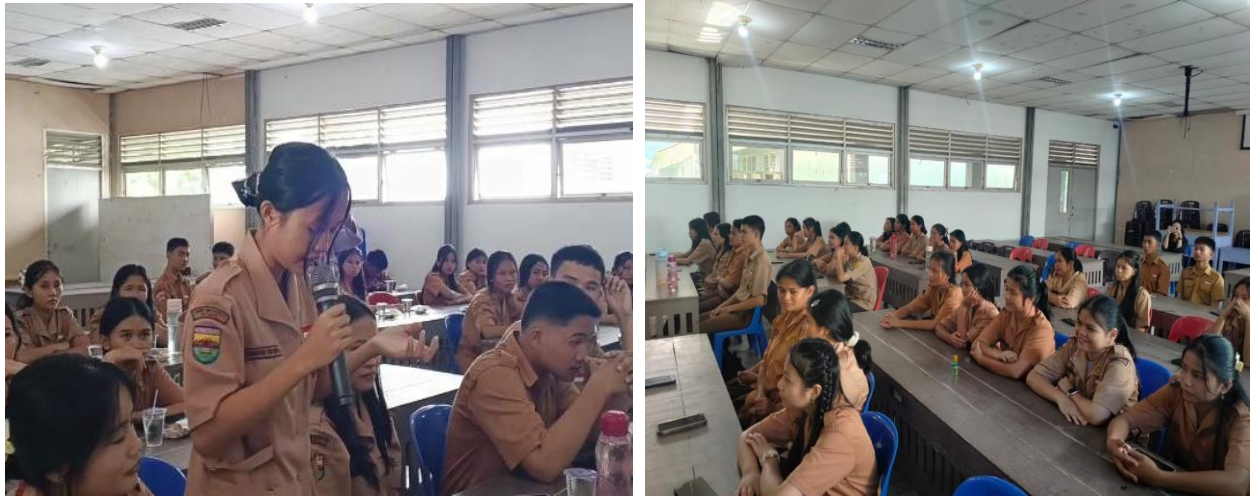
Gambar 4. Suasana Sesi Kuis dan Diskusi Tanya Jawab

Secara umum, hasil pengamatan selama kegiatan menunjukkan bahwa siswa SMA Negeri 1 Gido memiliki potensi yang sangat besar untuk berkembang menjadi generasi muda yang kreatif, produktif, dan berdaya saing. Potensi tersebut akan lebih maksimal jika terus dibina melalui kegiatan edukatif yang relevan dengan kebutuhan mereka. Edukasi manajemen yang diberikan dalam kegiatan ini telah membuka wawasan peserta mengenai pentingnya mengelola diri, memahami peran sumber daya manusia, serta memanfaatkan prinsip pemasaran dalam kehidupan modern. Dengan bekal ini, siswa diharapkan lebih siap menghadapi tantangan akademik, sosial, dan profesional di masa yang akan datang.