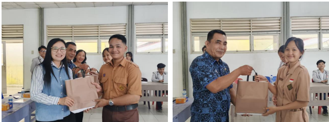
Gambar 5. Pemberian Hadiah Kepada Siswa yang Aktif

Kegiatan ini juga memperlihatkan bahwa pembelajaran yang bersifat praktis dan aplikatif sangat dibutuhkan oleh siswa sekolah menengah. Banyak konsep manajemen yang sebenarnya sederhana, tetapi memiliki dampak besar jika dipahami dan diterapkan secara konsisten. Misalnya, kebiasaan menyusun prioritas, membagi waktu, bekerja sama dengan teman, menghargai potensi diri, dan berani menampilkan keunggulan diri merupakan bagian dari penerapan manajemen dalam kehidupan sehari-hari. Melalui edukasi seperti ini, siswa tidak hanya memperoleh pengetahuan baru, tetapi juga dorongan untuk membangun kebiasaan positif yang akan berguna bagi masa depan mereka.