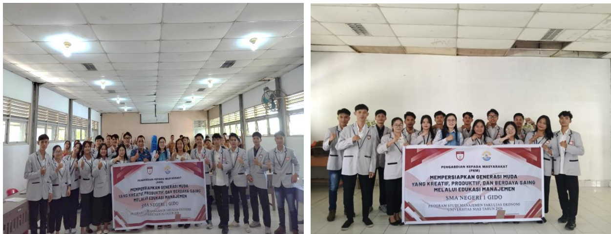
Gambar 6. Sesi Foto Bersama

Sesi foto bersama yang menjadi penutup kegiatan memiliki makna simbolis sebagai wujud kebersamaan dan dokumentasi pelaksanaan PKM. Walaupun berada di bagian akhir, sesi ini tetap penting karena menunjukkan bahwa seluruh rangkaian kegiatan telah terlaksana dengan baik dan diikuti oleh peserta hingga selesai. Dokumentasi ini juga dapat menjadi bukti administratif dan akademik bahwa kegiatan pengabdian telah dijalankan sesuai rencana. Secara keseluruhan, kegiatan ini berhasil mencapai tujuan utamanya, yaitu memberikan pemahaman awal tentang manajemen kepada siswa sebagai bekal membentuk generasi muda yang kreatif, produktif, dan berdaya saing.