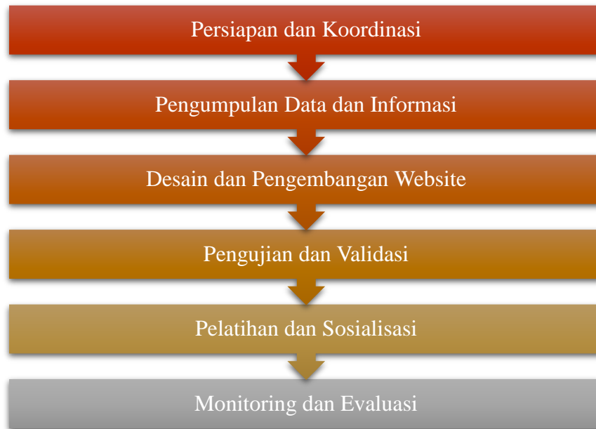
Gambar 1. Tahapan Pelaksanaan Program KKNT

Persiapan dan Koordinasi. Tahap awal dimulai dengan persiapan yang melibatkan koordinasi antara pihak universitas, pemerintah desa, dan masyarakat setempat. Tim mahasiswa melakukan diskusi awal untuk memahami kebutuhan dan harapan masyarakat terkait profil wisata desa. Selanjutnya, dilakukan pengumpulan data primer dan sekunder mengenai potensi wisata yang ada di Desa Belinteng.