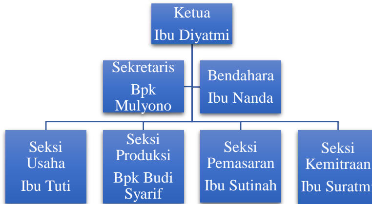
Gambar 2. Struktur re-Organisasi Kelompok Batik Mekar Wangi

Pertemuan tim pengabdian dengan mitra menghasilkan keputusan bahwa reorganisasi pengurus Kelompok Batik Mekar Wangi dibentuk berdasarkan hasil musyawarah anggota kelompok. Pergantian pengurus kelompok diperlukan karena faktor kesibukan masing-masing dari anggota kelompok. Selain itu, susunan organisasi yang tadinya hanya ketua, sekretaris dan bendahara, kini menjadi ada seksi usaha, seksi produksi, seksi pemasaran, dan seksi kemitraan. Berikut ini adalah bagan pengurus Kelompok Batik Mekar Wangi yang sudah direorganisasi beserta tugas dan fungsi setiap jabatannya.