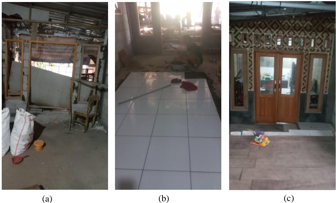
Gambar 1. (a), (b), (c) Perkembangan Pembuatan Sanggar Batik Mekar Wangi

Proses pembangunan Sanggar Batik UMKM Batik Mekar Wangi dimulai pada awal bulan Agustus 2023. Berikut ini adalah dokumentasi perkembangan pembangunan Sanggar Batik UMKM Batik Mekar Wangi yang didokumentasikan langsung oleh mitra.