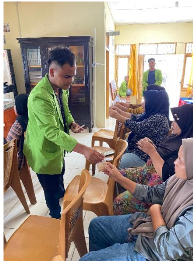
Gambar 2. Penyuluhan Pembuatan Jamu