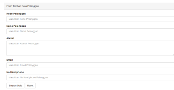
Gambar 4. Input Data Pelanggan

Input data pelanggan merupakan salah satu button pada sistem inventory yang digunakan untuk melakukan penginputan data pelanggan. Pada halaman input data barang terdapat beberapa button proses seperti simpan dan reset pada bagian bawah form. Proses input data pelanggan ini hanya bisa dilakukan oleh admin. Halaman input data pelanggan dapat dilihat pada Gambar dibawah ini.