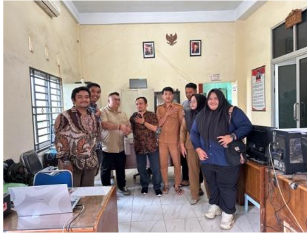
Gambar 6. Dokumentasi Tim Pelaksana Bersama Peserta Setelah Sesi Pelatihan Dan Sosialisasi 5. Input Proses EOQ

Input proses EOQ merupakan salah satu button pada sistem inventory yang digunakan untuk melakukan penginputan proses EOQ. Pada halaman input data EOQ terdapat beberapa button proses seperti proses data dan reset pada bagian bawah form. Proses input proses EOQ ini hanya bisa dilakukan oleh admin. Halaman input proses EOQ dapat dilihat pada Gambar dibawah ini.