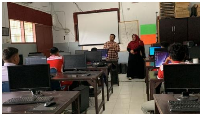
Gambar 5. Pelatihan Langsung Penggunaan Sistem Informasi Inventori Berbasis EOQ

Dokumentasi kegiatan pelatihan dan sosialisasi menunjukkan bahwa peserta terlibat aktif dalam praktik langsung penggunaan sistem informasi inventori berbasis metode EOQ. Kegiatan ini berlangsung dalam suasana interaktif, di mana peserta mendapatkan arahan teknis mengenai penggunaan fitur-fitur utama sistem, serta simulasi perhitungan jumlah pemesanan optimal. Gambar di bawah ini memperlihatkan pelaksanaan kegiatan secara nyata.