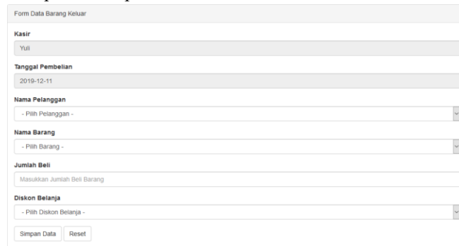
Gambar 8. Input Barang Keluar

Input barang keluar merupakan salah satu button pada sistem inventory yang digunakan untuk melakukan penginputan barang keluar. Pada halaman input barang keluar terdapat beberapa button proses seperti simpan data dan reset pada bagian bawah form. Proses input barang keluar ini hanya bisa dilakukan oleh admin. Halaman input barang keluar dapat dilihat pada Gambar dibawah ini.