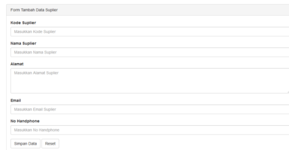
Gambar 2. Input Data Suplier

Input data suplier merupakan salah satu button pada sistem inventory yang digunakan untuk melakukan penginputan data suplier. Pada halaman input data suplier terdapat beberapa button proses seperti simpan dan reset pada bagian bawah form. Proses input data suplier ini hanya bisa dilakukan oleh admin. Halaman input data suplier dapat dilihat pada Gambar dibawah ini.