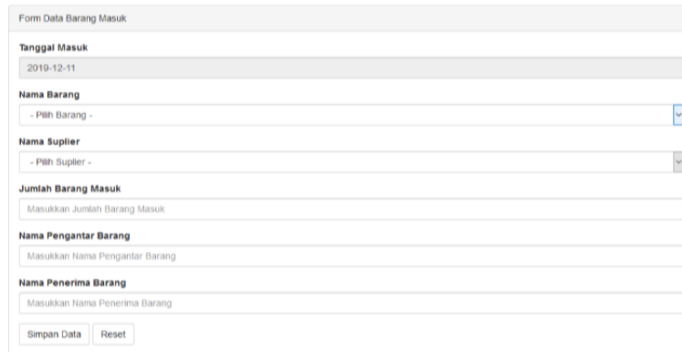
Gambar 8. Input Barang Masuk