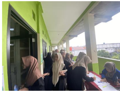
Gambar 1. Tahapan awal kegiatan pengmas

Program Pengabdian kepada Masyarakat bertajuk “Penguatan Literasi Keuangan dan Manajemen Risiko Keuangan bagi Santriwati: Meneladani Khadijah & Aisyah R.A” telah dilaksanakan pada 27 Juni 2025 di Pondok Pesantren Darussalam, Poris Jaya, Kota Tangerang. Kegiatan ini diikuti oleh 82 santriwati tingkat SMP dan SMA yang menjadi target utama edukasi literasi keuangan berbasis nilai-nilai Islam. Rangkaian kegiatan terdiri dari pre-test , penyampaian materi, simulasi kelompok, diskusi inspiratif tentang teladan Khadijah RA dan Aisyah RA, serta post-test untuk mengukur pemahaman peserta. Tujuan utama kegiatan adalah meningkatkan pemahaman dan keterampilan santriwati dalam mengelola keuangan pribadi serta menghadapi risiko finansial berbasis nilai-nilai Islam.