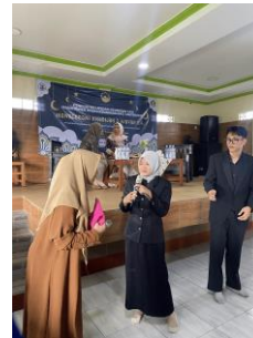
Gambar 5. Sesi diskusi tanya jawab

Sesi berikutnya merupakan studi kasus yang mengangkat keteladanan Khadijah dan Aisyah R.A., dua figur muslimah yang dikenal dengan kejujuran, kecermatan, dan keberanian dalam mengelola keuangan dan bisnis. Melalui pendekatan studi kasus ini, peserta diajak untuk menelaah nilai-nilai moral dan etika yang terkandung dalam kisah hidup kedua tokoh tersebut, serta bagaimana nilai-nilai tersebut dapat diaplikasikan dalam pengelolaan keuangan pribadi dan sosial. Peserta dibagi dalam kelompok kecil untuk berdiskusi dan mempresentasikan hasil analisis mereka, sehingga proses pembelajaran menjadi lebih kontekstual dan relevan dengan pengalaman sehari-hari mereka. Pendekatan berbasis nilai Islami ini tidak hanya memperkuat aspek kognitif, tetapi juga membentuk sikap dan karakter peserta agar mampu mengelola keuangan sesuai syariat, sebagaimana didukung oleh penelitian Farida (2022) yang menunjukkan bahwa integrasi nilai keagamaan dalam edukasi literasi keuangan meningkatkan motivasi dan kesadaran finansial remaja Muslim.