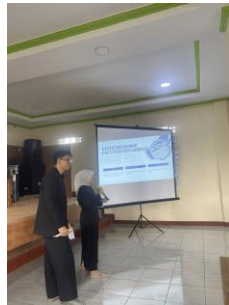
Gambar 4. Pemaparan materi ketiga

inflasi, dan pentingnya menyiapkan dana darurat sebagai penyangga keuangan. Pada sesi ini, peserta juga dikenalkan dengan konsep takaful atau asuransi syariah, yang merupakan bentuk proteksi keuangan yang sesuai dengan prinsip-prinsip Islam. Pemahaman mengenai manajemen risiko ini sangat krusial agar peserta dapat mengantisipasi dan meminimalkan dampak negatif dari risiko keuangan, sehingga mereka dapat menjaga kestabilan keuangan pribadi dan keluarga. Penyampaian materi ini diperkaya dengan diskusi kelompok yang interaktif, memberikan kesempatan kepada peserta untuk berbagi pengalaman dan menggali pemahaman lebih dalam terkait pengelolaan risiko keuangan dalam konteks kehidupan mereka di pesantren. Pendekatan ini sesuai dengan prinsip pembelajaran aktif yang menekankan keterlibatan peserta secara langsung untuk meningkatkan pemahaman dan penerapan materi (Bonwell & Eison, 2020).