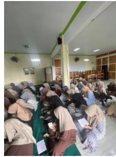
Gambar 2. Pengisian post-test

Sebagai penutup, peserta diminta mengisi post-test dengan menggunakan instrumen yang sama seperti pre-test . Pengisian post-test ini bertujuan untuk mengidentifikasi perubahan dan peningkatan pengetahuan serta sikap peserta setelah mengikuti seluruh rangkaian psikoedukasi. Analisis perbandingan antara hasil pre-test dan post-test menjadi indikator utama efektivitas program, sekaligus menjadi dasar evaluasi untuk pengembangan program literasi keuangan dan manajemen risiko keuangan di masa depan. Pendekatan evaluasi ini sejalan dengan prinsip evaluasi pembelajaran yang menekankan pentingnya pengukuran hasil sebagai tolok ukur keberhasilan intervensi edukatif (Huston, 2010). Secara keseluruhan, pelaksanaan psikoedukasi ini mengintegrasikan metode pembelajaran interaktif, kontekstual, dan berbasis nilai, yang terbukti efektif dalam meningkatkan literasi keuangan dan kesadaran manajemen risiko di kalangan santriwati. Keterlibatan aktif peserta melalui diskusi, simulasi, dan studi kasus memperkuat pemahaman dan aplikasi materi, sehingga diharapkan mampu membentuk perilaku keuangan yang sehat dan berkelanjutan sesuai dengan prinsip syariah.