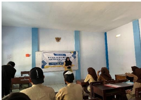
Gambar 2. Materi Pendewasaan Usia Perkawinan

Materi kedua dalam orientasi adalah pencegahan pernikahan dini. Topik ini dibawakan dengan pendekatan yang santai dan terbuka untuk mematahkan tabu. Diskusi mencakup penjelasan ilmiah mengenai risiko medis dari kehamilan di usia remaja yang berhubungan langsung dengan stunting, dampak sosial seperti putus sekolah, serta pentingnya pendewasaan usia perkawinan (PUP) untuk merencanakan masa depan. Pendewasaan usia perkawinan bertujuan mendorong usia ideal menikah sesuai standar BKKBN agar remaja siap secara fisik, emosional, dan sosial dalam menjalani kehidupan berkeluarga (Choyrin Nizwa et al. , 2023). Pada sesi ini, para siswa menunjukkan sikap yang cenderung pasif dan malu. Namun, kendala ini diatasi dengan menggunakan metode studi kasus anonim dan permainan peran ( role-playing ), yang berhasil mencairkan suasana dan mendorong partisipasi aktif. Para siswa mulai berani bertanya dan berbagi pandangan mengenai tantangan yang mereka hadapi sehari-hari, seperti tekanan pergaulan dan minimnya informasi yang akurat.