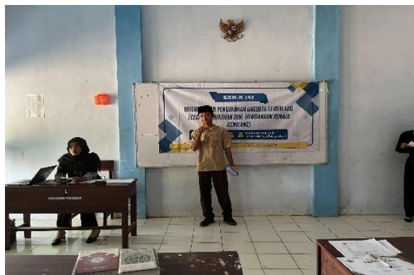
Gambar 3. Praktek public speaking

Materi yang disampaikan tidak hanya berfokus pada aspek kesehatan, tetapi juga pada pengembangan soft skills . Sesi public speaking sederhana, misalnya, bertujuan untuk membekali para calon konselor sebaya dengan kepercayaan diri untuk berbicara di depan teman-temannya. Antusiasme tertinggi terlihat pada sesi ini, di mana para siswa diberikan kesempatan untuk mempraktikkan cara menyampaikan pesan edukatif dengan gaya mereka sendiri. Hal ini menunjukkan adanya potensi besar pada remaja di Desa Sukorejo yang selama ini belum tersalurkan karena tidak adanya wadah yang tepat. Pelatihan public speaking yang dilaksanakan melalui program pembelajaran partisipatif memberikan peningkatan signifikan pada kepercayaan diri dan kemampuan komunikasi remaja, sekaligus mendorong tumbuhnya jiwa kepemimpinan dan partisipasi aktif dalam komunitas (Aziz et al. , 2025).