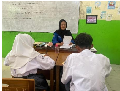
Gambar 1. Persiapan Listening Comperhension