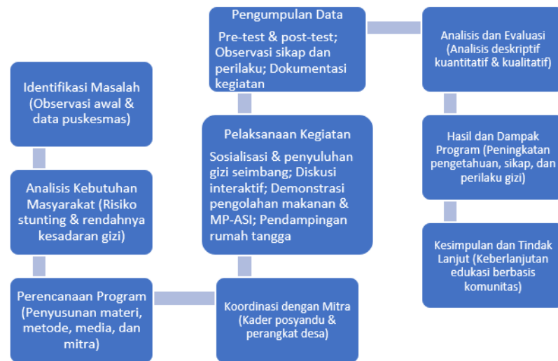
Gambar 1. Diagram Alir Pengabdian

Gambar 1. Diagram alur pelaksanaan pengabdian kepada masyarakat yang menunjukkan tahapan kegiatan secara sistematis, mulai dari identifikasi masalah dan analisis kebutuhan masyarakat, perencanaan dan koordinasi dengan mitra, pelaksanaan edukasi gizi seimbang berbasis partisipatif, hingga pengumpulan data, analisis hasil, serta evaluasi capaian program sebagai upaya pencegahan stunting di Desa Sri Kuncoro.