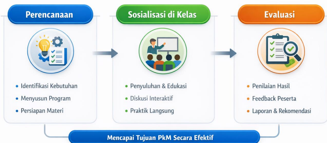
Gambar 1. Tahapan Pengabdian kepada Masyarakat (PkM)

Kegiatan Pengabdian kepada Masyarakat (PkM) ini dibagi menjadi tiga tahapan utama: perencanaan, sosialisasi di kelas, dan evaluasi. Setiap tahapan dilakukan secara sistematis untuk memastikan bahwa kegiatan berjalan efektif dan mencapai tujuan yang telah ditetapkan, dapat dilihat pada gambar berikut: