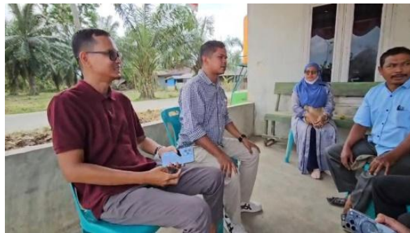
Gambar 3. Koordinasi dengan Perangkat Desa

Setelah permasalahan teridentifikasi, tahap selanjutnya adalah melakukan koordinasi dengan pemerintah desa sebagai mitra dalam pelaksanaan kegiatan pengabdian. Koordinasi ini bertujuan untuk menyampaikan rencana program yang akan dilaksanakan serta memperoleh dukungan dari pihak pemerintah desa. Pada tahap ini tim pengabdian melakukan pertemuan dengan kepala desa serta perangkat desa untuk membahas lokasi kegiatan, jumlah masyarakat penerima manfaat, serta fasilitas yang dapat digunakan selama pelaksanaan kegiatan. Selain itu, pemerintah desa turut berperan dalam menentukan lokasi yang paling tepat untuk pemasangan teknologi filter air agar dapat dimanfaatkan secara optimal oleh masyarakat.