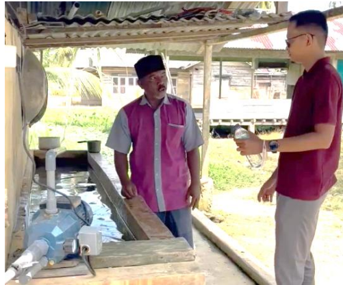
Gambar 2. Pengambilan Sampel Air Sumur

Setelah permasalahan teridentifikasi, tahap selanjutnya adalah melakukan koordinasi dengan pemerintah desa sebagai mitra dalam pelaksanaan kegiatan pengabdian. Koordinasi ini bertujuan untuk menyampaikan rencana program yang akan dilaksanakan serta memperoleh dukungan dari pihak pemerintah desa. Pada tahap ini tim pengabdian melakukan pertemuan dengan kepala desa serta perangkat desa untuk membahas lokasi kegiatan, jumlah masyarakat penerima manfaat, serta fasilitas yang dapat digunakan selama pelaksanaan kegiatan. Selain itu, pemerintah desa turut berperan dalam menentukan lokasi yang paling tepat untuk pemasangan teknologi filter air agar dapat dimanfaatkan secara optimal oleh masyarakat.