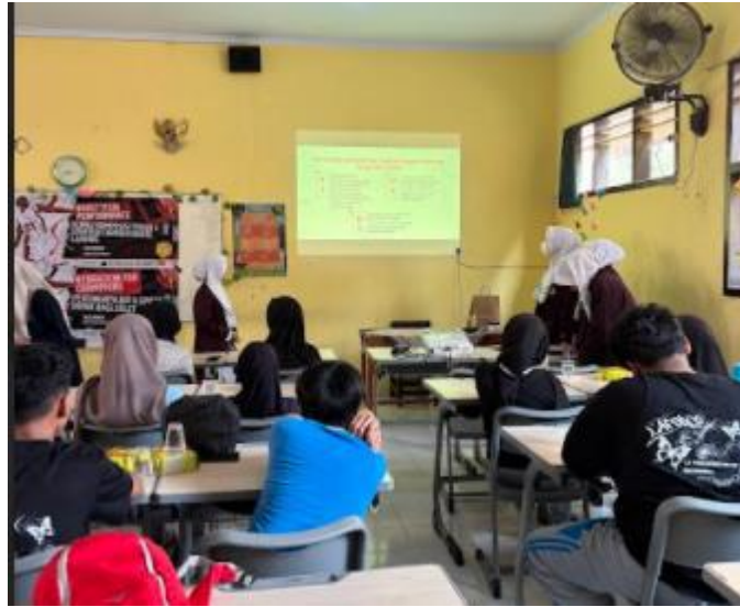
Gambar 3. Penyampaian materi