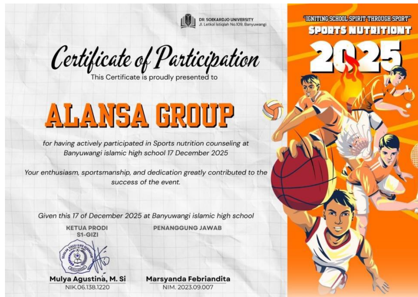
Gambar 2. Sertifikat kegiatan