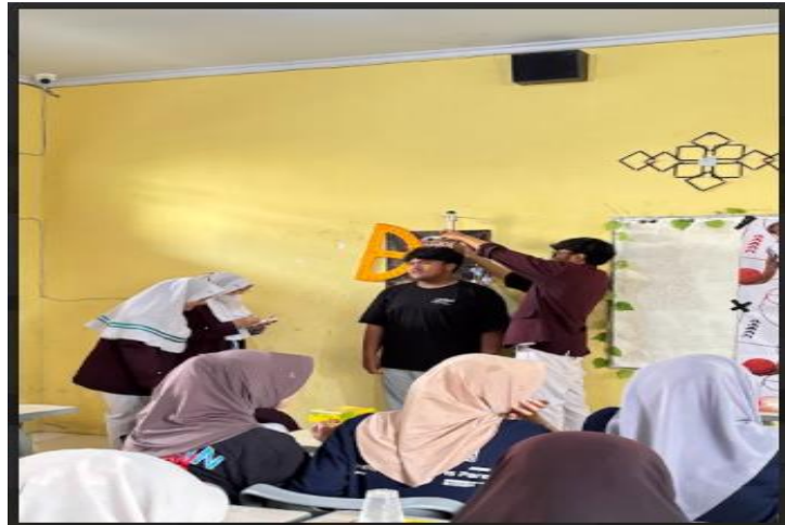
Gambar 1. Foto Kegiatan pengukuran BB, TB dan prosentase lemak tubuh