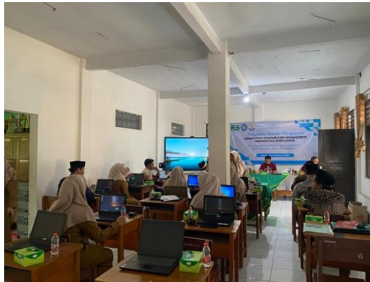
Gambar 3. Proses evaluasi dan Tidak Lanjut

Setelah kegiatan selesai, dilakukan sesi refleksi dan sharing di mana peserta dapat berbagi pengalaman dan tantangan yang dihadapi selama pelatihan dan implementasi. Para guru menyatakan bahwa pelatihan ini memberikan wawasan baru tentang bagaimana menjadi pemimpin yang lebih bijaksana dan mampu membawa perubahan positif di dalam kelas. Banyak peserta yang merasa lebih percaya diri dalam menggunakan teknologi dan lebih sadar akan pentingnya nilai-nilai spiritual dalam kepemimpinan mereka, sedangkan hasil observasi dan refleksi menunjukkan perubahan pada praktik pembelajaran. Sebanyak 70% guru melaporkan peningkatan keterlibatan siswa selama proses pembelajaran, khususnya ketika guru mulai mengombinasikan keteladanan sikap spiritual dengan pemanfaatan media digital. Dalam periode satu bulan setelah pendampingan, guru melaporkan adanya peningkatan hasil belajar siswa sebesar \pm 15\% , yang diukur dari nilai tugas dan partisipasi kelas.