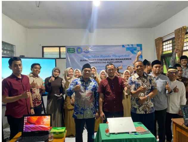
Gambar 2. Pelaksanaan Pelatihan